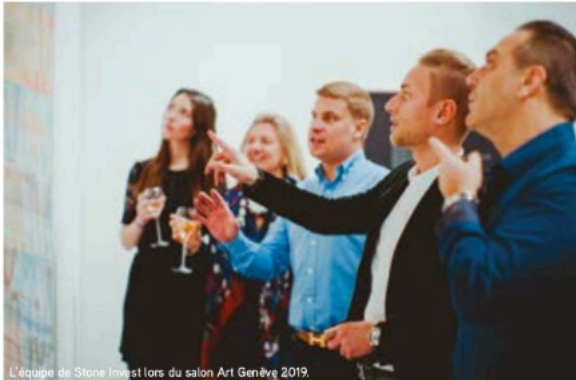
L'équipe de Stone Invest lors du salon Art Genève 2019.