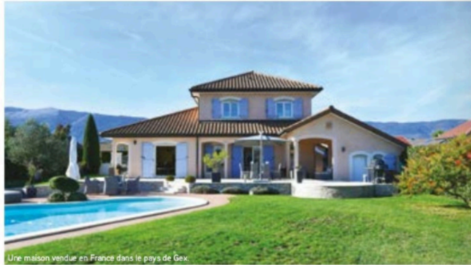
Une maison vendue en France dans le pays de Gex.